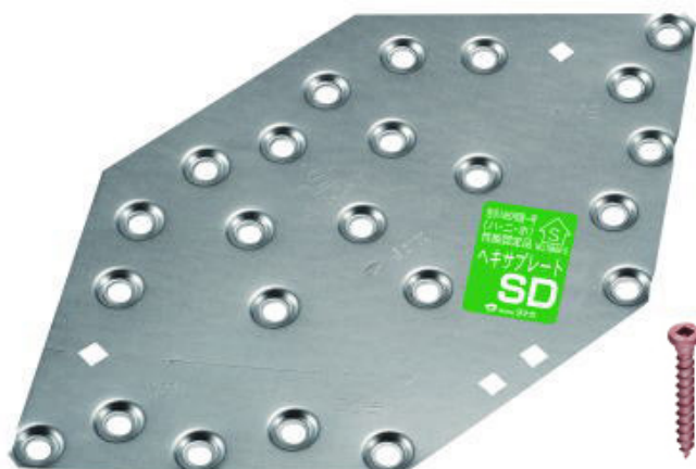
専用角ビットビス TBA-45(使用本数17本)